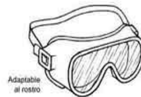
Adaptable al rostro